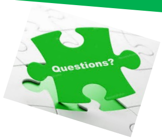
CSAPA La Porte Ouverte à Saint-Omer